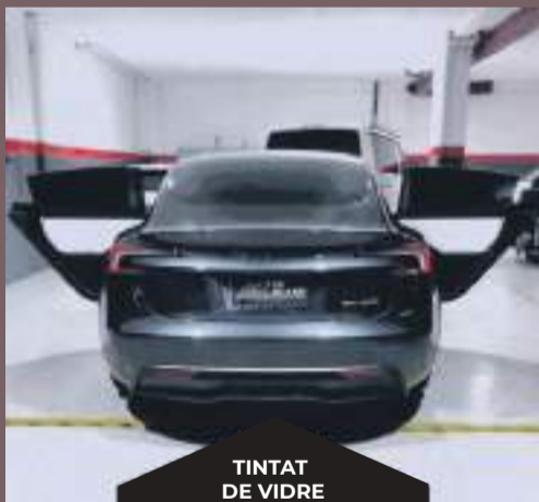
TINTAT DE VIDRE