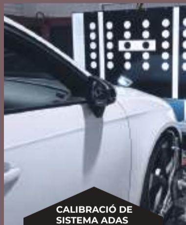
CALIBRACIÓ DE SISTEMA ADAS