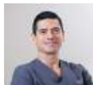
Dr. Carlos Barrios

Tard o d'hora, tots desenvoluparem cataractes, ja que, de la mateixa forma que la presbícia, estan relacionades amb canvis anatòmics secundaris a l'envelliment. Els símptomes són molt diversos i no solen presentar-se tots alhora, des de visió borrosa i enlluernament fins a canvis refractius o percepció de colors més apagats i menys intensos, etc.